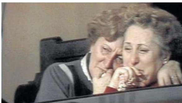
El proceso judicial argentino de 1985 en 'El juicio', clausura del apartado.