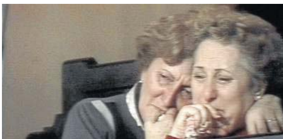
El proceso judicial argentino de 1985 en 'El juicio', clausura del apartado.