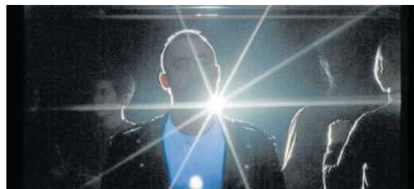
'Mamántula', del urnietarra Ion de Sosa.