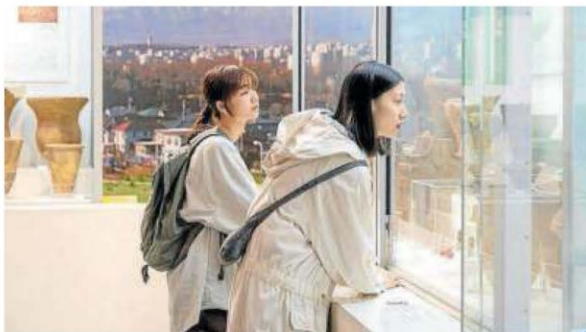
La japonesa 'Remembering Every Night' inaugurará la sección.

También debuta en el largo el chino Wu Lang con Absence , que competirá en Donostia por partida doble, ya que también ha sido selecciona-