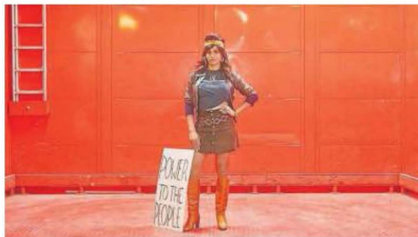
'Orlando, mi biografía política', de Paul B. Preciado.