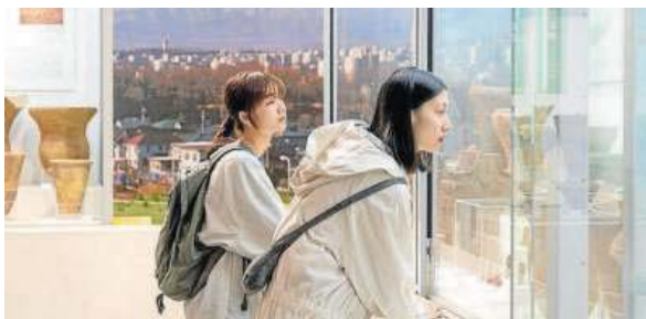
La japonesa 'Remembering Every Night' inaugurará la sección.

El productor, guionista y actor de la ganadora de la Concha de Oro Beginning , de Dea Kulumbegashvili, Rati Oneli, dirige el cortometraje We Are The Hollow Men , mientras que el belga Bas Devos competirá con