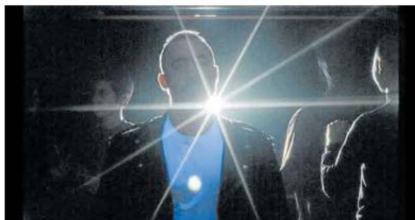
'Mamántula', del urnietaarra Ion de Sosa.