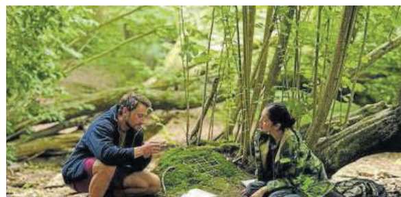
La ganadora de la sección Encounters de la Berlinale, 'Here'.

la ganadora del premio a la mejor película de la sección Encounters de la Berlinale, Here .