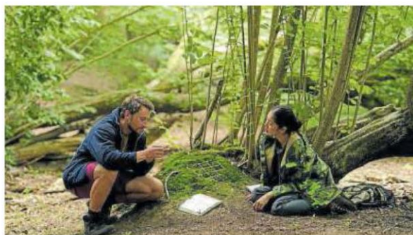
La ganadora de la sección Encounters de la Berlinale, 'Here'.