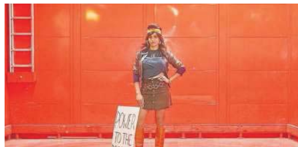
'Orlando, mi biografía política', de Paul B. Preciado.